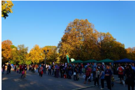
Щандовете на номинираните за наградите