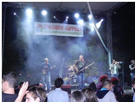
„Уикеда“ се раздадоха за публиката