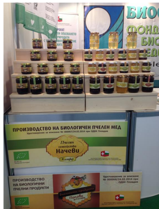
Различни видове мед на първите двама регистрирани по Наредба 26 производители бяха представени на щанда