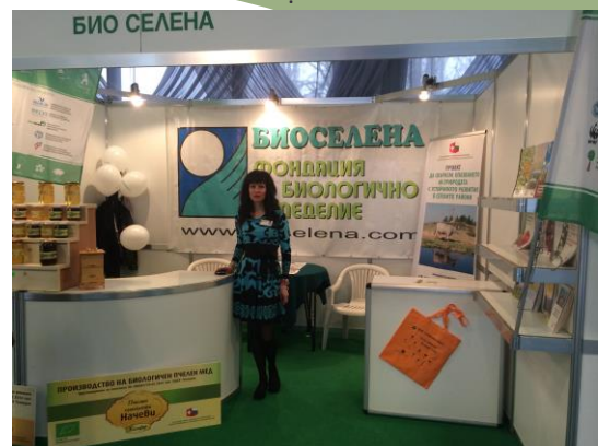
Щандът на проекта