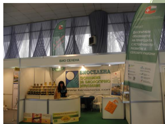
БиоАгра привлича земеделски производители от цялата страна