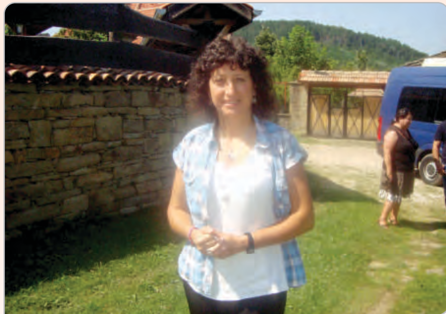
Бившият директор на Природен парк „Българка“ се включи в пътуващия семинар на WWF-България, разясняващ плащанията за екосистемни услуги, като дейност по българо-швейцарския проект „За Балкана и хората“

Частните гори заемат около 40 процента от територията на парка. Има ги и в буковия, и в дъбовия пояс. Има и вековни букови гори, които са възстановени на частници. В тях се извеждат и възобновителни сечи. Имам спомен от миналата година за такъв един имот, малко под местността Узана, където наблюдавахме птици във връзка с реализацията на единия наш проект, касаещ защита местообитанията на полубеловратата мухоловка. Територията на Природен парк „Българка“ е обявена зона по Директивата за птиците точно за защита на местообитанията на полубеловратата мухоловка. В този имот беше извършена сеч преди три-четири години. И в крайна сметка, след като дадохме становище и написахме, че там има гнезда на полубеловратата мухоловка, че е извършвана сеч и няма да се постигне ефектът на дълъг възобновителен процес, Регионалната дирекция по горите разреши отново възобновителна сеч и мисля, че беше окончателна фаза. А то-