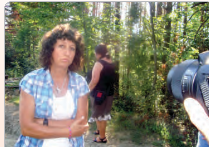
В горите на Плачковското горско стопанство