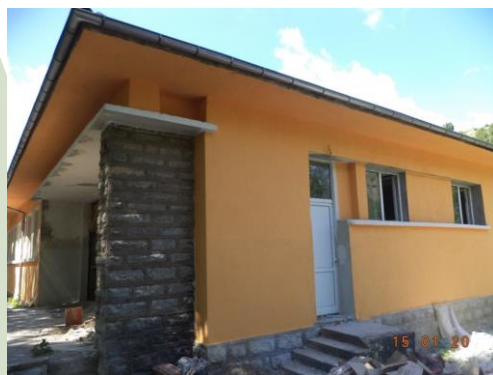
ремонтация се цех на Синевка ООД

Тече втора сесия на Програмата, водена от АПБ. Подробности за напредъка на първите финансирани проекти и за новата сесия четете на стр.9