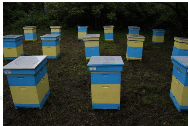
Кошери в с.Зелено дърво

В офиса на АПБ бяха подадени 4 броя проектни предложения. На 11.08.2014 г. беше назначена петчленна комисия, която да определи кои две предложения ще бъдат финансирани по програмата. Предвид установени пропуски и необходимост от допълнителни уточнения, по представените проекти, комисията предложи да се проведе втори кръг за избор на кандидати.