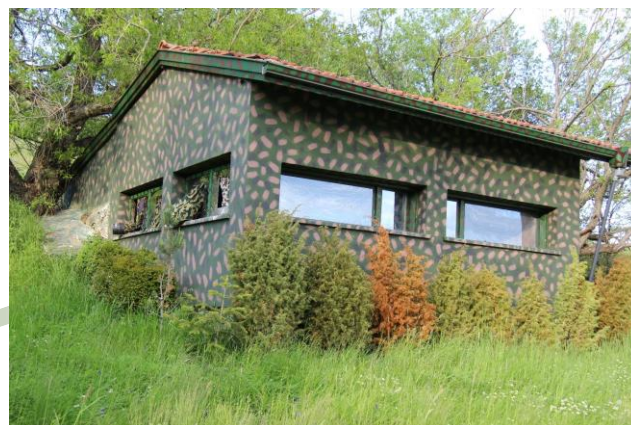
Укритие за фотозаснемане в Понор планина