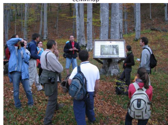
Имаше и време за посещение на района на Централен Балкан