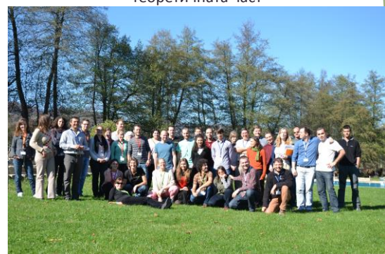
Цялата група, която се включи в международния семинар