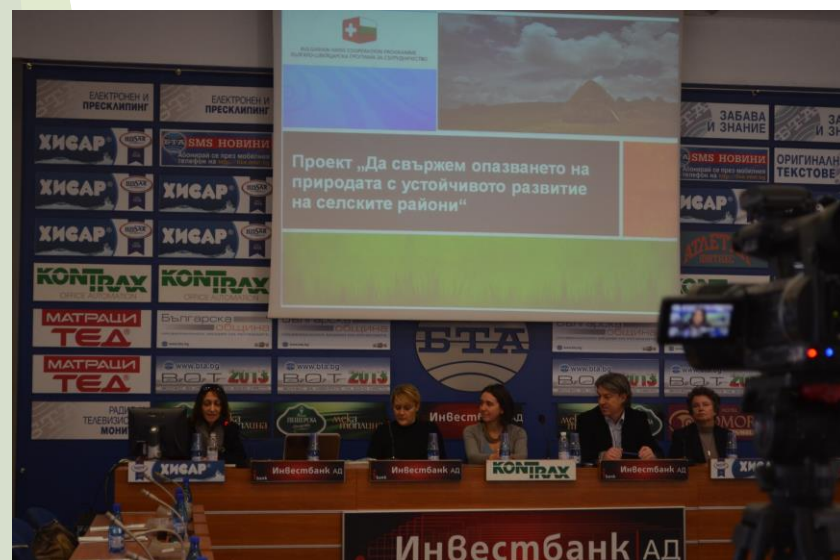
Кръгла маса за екосистемните услуги