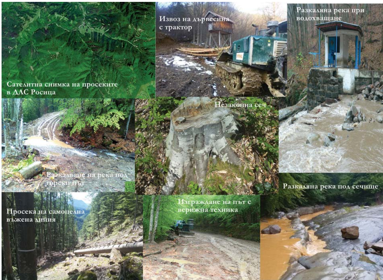
Нарушения, описани в ДЛС Росица